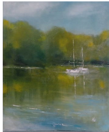
Inne i viken