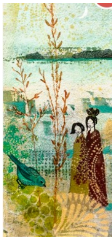
Det som höll oss kvar