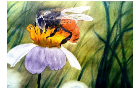
Blommornas hemliga besökare