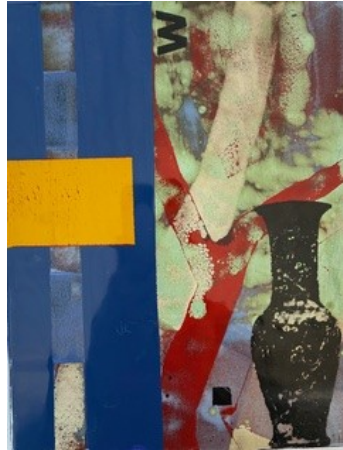
Arkeologi för poeter